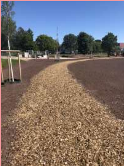
Lenzwiese“ (hinterm Lidl).

Die Bilder zeigen den neugestalteten Bereich im Areal „An der